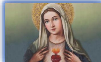
La Iglesia dedica el mes de mayo a la Madre María