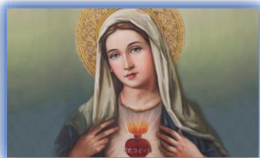
La Iglesia dedica el mes de mayo a la Madre María

Momentos felices, Alaba a Dios. Momentos difíciles, Busque a Dios. Momentos tranquilos Alabar a Dios. Momentos dolorosos Confía en Dios. Cada momento, Gracias a Dios.